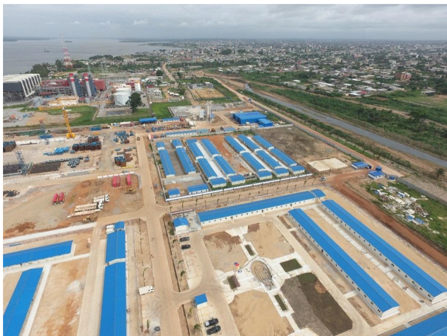
中国港湾项目现场