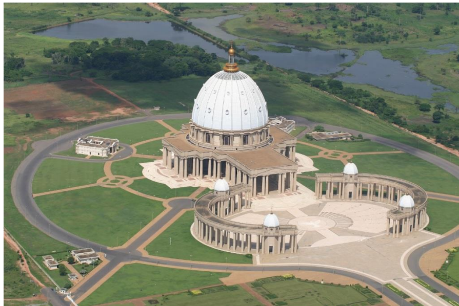
亚穆苏克罗大教堂

科特迪瓦42%的居民信奉伊斯兰教，34%信奉基督教，16.7%无宗教信仰，其余信奉原始宗教（拜物教）等。伊斯兰教集中在北部地区，基督教在南部，拜物教则遍及全国各地。