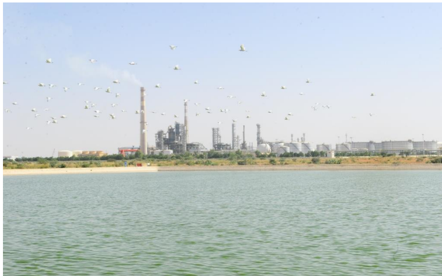
中尼合资津德尔炼厂

【工业】基础薄弱，结构单一，以炼油业为主。2019年工业增加值占国内生产总值的18.44%。主要有石油化工、电力、纺织、采矿、农牧产品加工、食品、建筑和运输业等。全国现有58家中小型企业，其中实际运营的有43家。采矿业产值占国内生产总值的6-7%。有两家大型铀矿开采合营公司——阿伊尔矿业公司(SOMAIR)和阿库塔矿业公司(COMINAK)，尼日尔政府分别占33%和31%的股份。中核投资的阿泽里克铀矿维持技术性停产，法国阿海珐公司开发的伊姆拉郎矿继续停建。