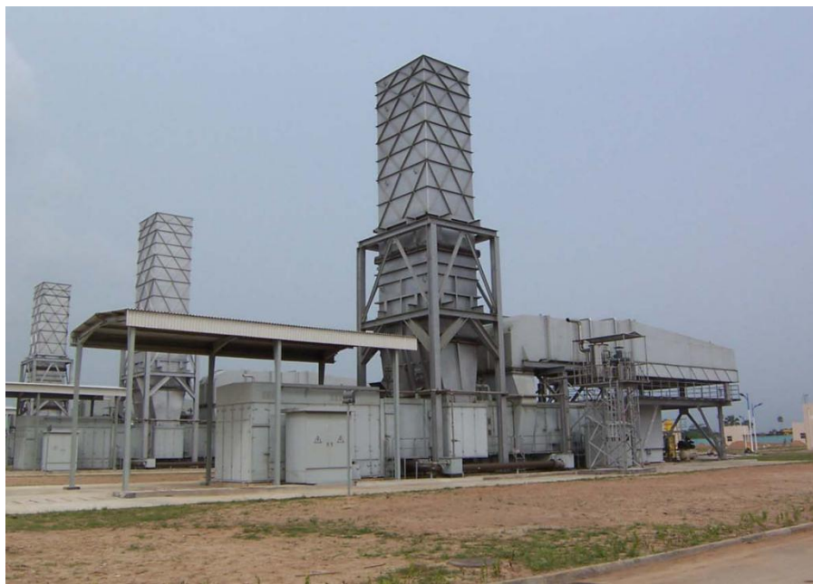
帕帕兰多燃机电站一期工程

【承包劳务】据中国商务部统计，2019年中国企业在尼日利亚新签承包工程合同174份，新签合同额125.57亿美元，完成营业额45.96亿美元。累计派出各类劳务人员6694人，年末在尼日利亚劳务人员12199人。新签大型承包工程项目包括中国铁建国际集团有限公司承建阿布贾-巴罗-阿贾奥库塔中线铁路项目和朱库拉-洛克贾支线铁路项目；中国水电建设集团国际工程有限公司承建尼日利亚新月岛填海造地和高架桥梁工程项目；中国能源建设集团国际工程有限公司承建尼日利亚Petrolex 1200MW 联合循环燃气电站项目等。