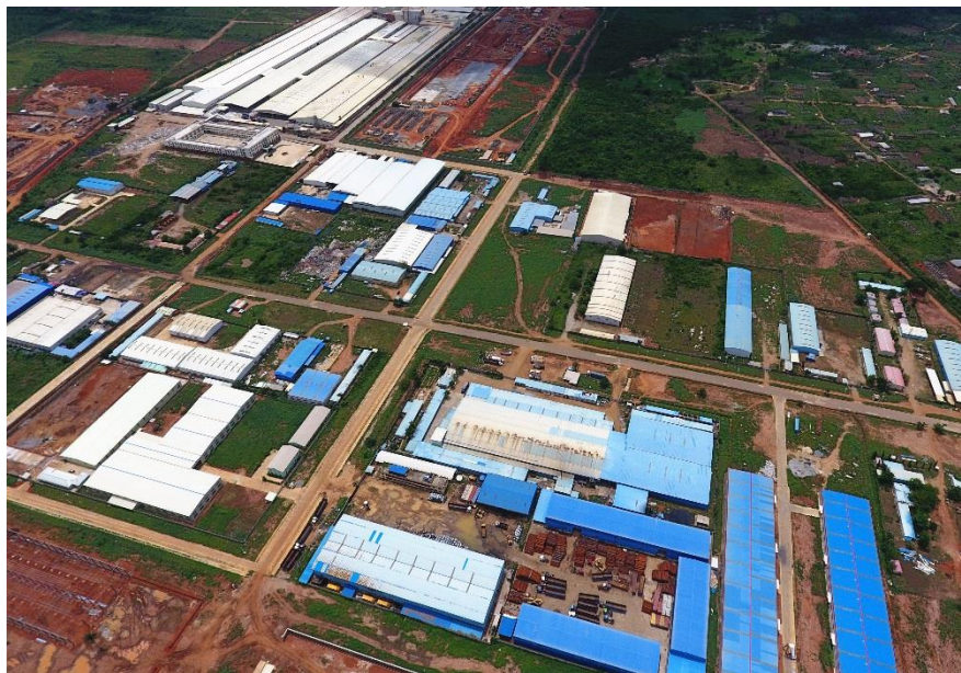
奥贡自贸区内部航拍图