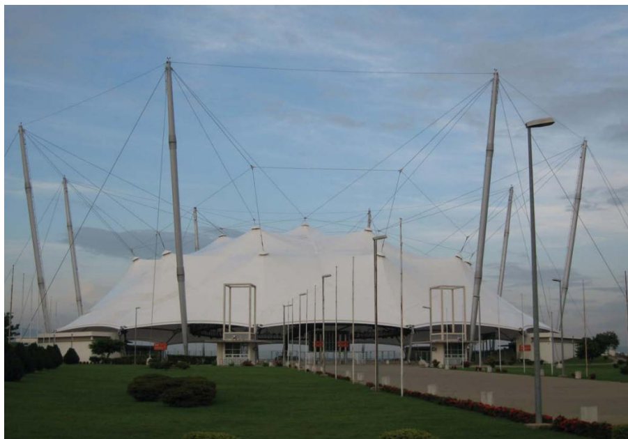
阿布贾国家体育馆