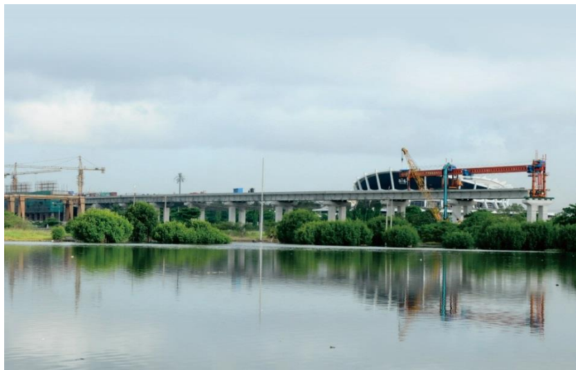
拉各斯轻轨施工场景

系统只能提供最低程度的运输服务。目前，尼日利亚正在建设拉各斯轻轨和阿布贾城铁项目。2016年7月，阿布贾至卡杜纳铁路（186.5公里）投入运营，截至2020年4月已安全运营超1300天，发送旅客逾200万人次。2018年7月，阿布贾城铁一期（45.2公里）投入运营，截至目前已安全运营近700天。2017年3月，尼日利亚铁路现代化项目二期（拉各斯-伊巴丹段）开工建设，全长156公里，预计2020年正式运营。