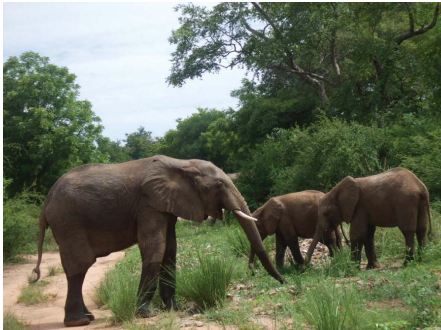
包奇州野生动物园

【部族冲突】由于历史和现实的原因，尼日利亚部族之间隔阂较大，少数部族之间积怨甚深，矛盾错综复杂，有时会爆发部族之间的武装冲突，造成人员伤亡。近年来，尼日利亚种族冲突愈演愈烈，已造成逾千人死亡，数万人流离失所。