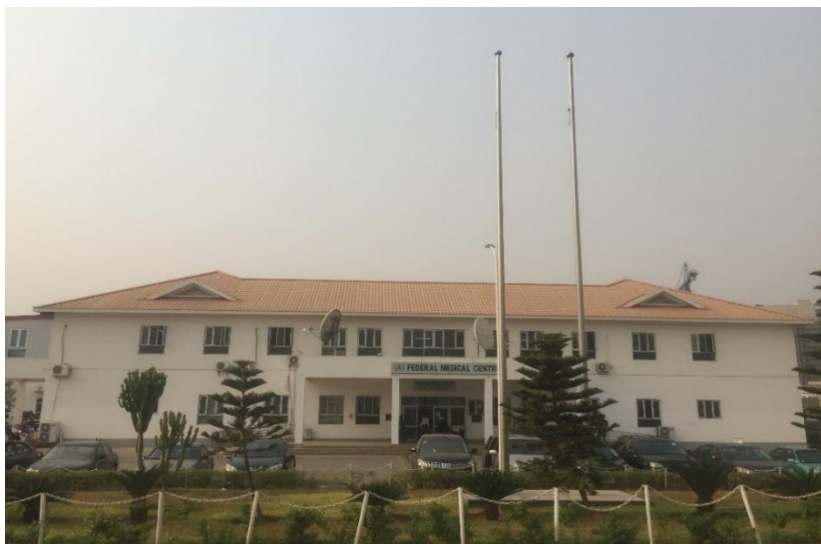
尼日利亚综合医院

跨国公司在尼日利亚投资的主要领域是石油天然气行业，如美国的雪弗龙-德士古和埃克森美孚、荷兰的壳牌、法国的道达尔、意大利的埃尼集团等。投资其他领域的跨国公司有：西门子、MTN、本田汽车、标致汽车、可口可乐和雀巢等。