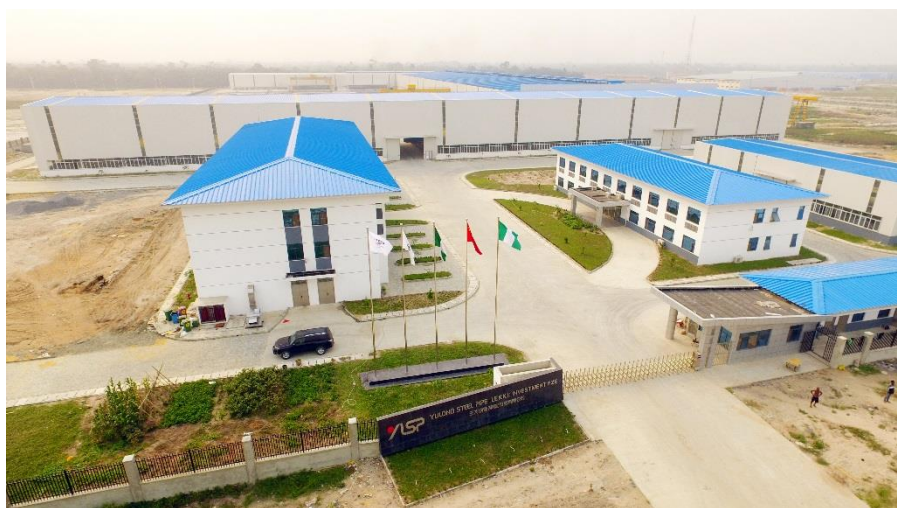
莱基自贸区玉龙钢管厂区 尼日利亚联邦政府和州政府广泛参与各园区建设经营，以土地或资金