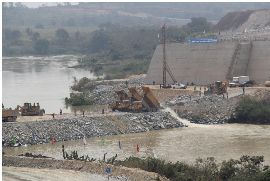
宗格鲁水电站截流

尼日利亚现有发电量约70%来自热电，30%来自水电，且多数发电设备陈旧，缺乏应有的维护和保养，同时还面临天然气供应不足、偷电严重等问题。由于供电紧缺，尼日利亚大部分政府机关、事业单位以及97%以上的企业不得不自备发电机发电，电力供需矛盾成为阻碍尼日利亚经济发展的主要问题之一。