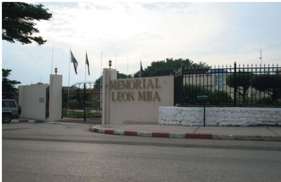
开国总统姆巴纪念堂

加蓬是中部非洲经济和货币共同体（CEMAC）、中部非洲国家银行、非洲开发银行、非洲经济委员会、非洲联盟的成员。