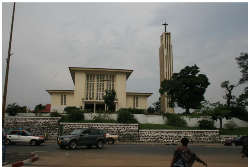
利伯维尔市中心的圣玛丽大教堂

加蓬人见面的称谓与问候很讲究，要在姓氏前加上先生、夫人、小姐等尊称。与对方见面一般要预约，贸然到访属于不礼貌行为。加蓬人一般不太准时，办事效率不高。忌讳向加蓬人问个人收入等隐私问题。