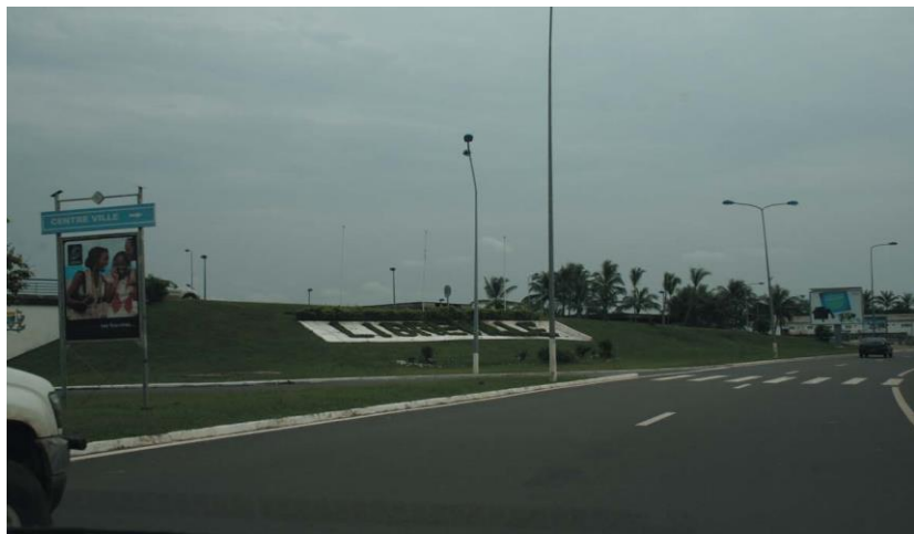
利伯维尔海滨大道起点

同非洲其他国家一样，加蓬同样面临着基础设施落后的状况，全国只有1条铁路。近些年来，加蓬政府在基础设施方面加大投入力度，但交通运输网络、港口设施的运行能力仍显落后，满足不了国内矿石和木材等物资运输的需求。