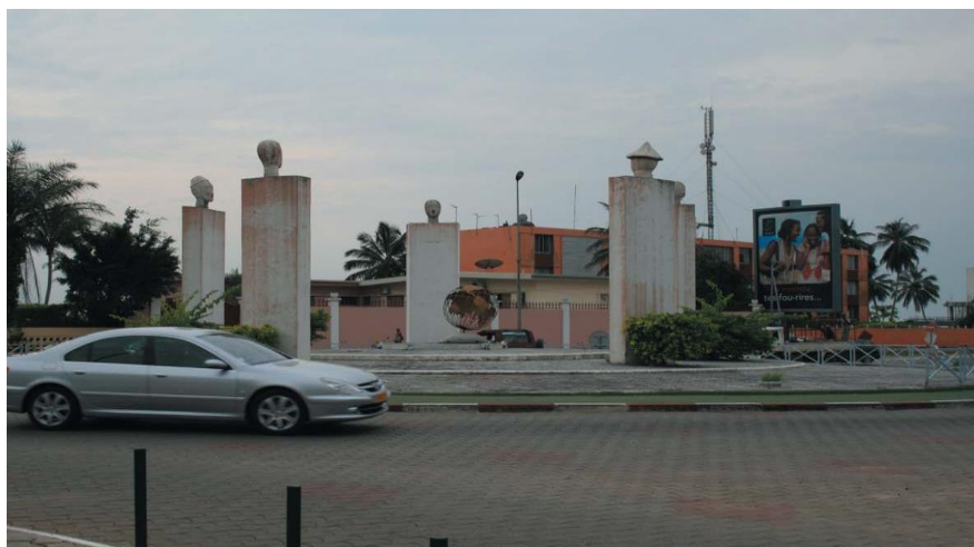
利伯维尔机场环岛

以首都利伯维尔为核心的空运是加蓬旅客运输的主要方式。加蓬拥有44个公共机场，其中利伯维尔、让蒂尔港和弗朗斯维尔3个机场为国际机场。加蓬航空公司承接国内和国际航运业务，拥有波音747大型客机，并有通往非洲和欧洲的20多条国际航线。其中主要航线包括利伯维尔-巴黎、利伯维尔-亚得斯亚贝巴、利伯维尔-约翰内斯堡等，同时可以飞往邻国刚果（布）、刚果（金）、喀麦隆、圣普和赤道几内亚等。2012年，加蓬空运输送旅客83万人次，同比增长7%。中国通往加蓬的主要航线为国内城市-巴黎-利伯维尔和国内城市-亚的斯亚贝巴-利伯维尔。