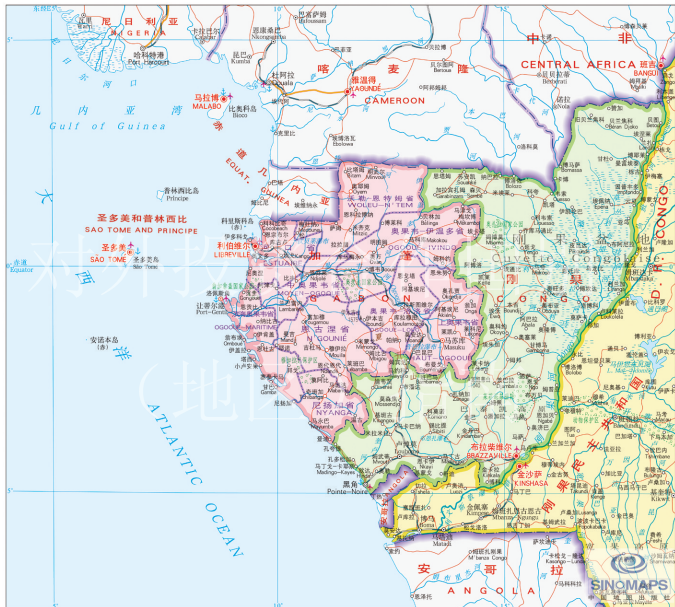
地图来源：中国地图出版社